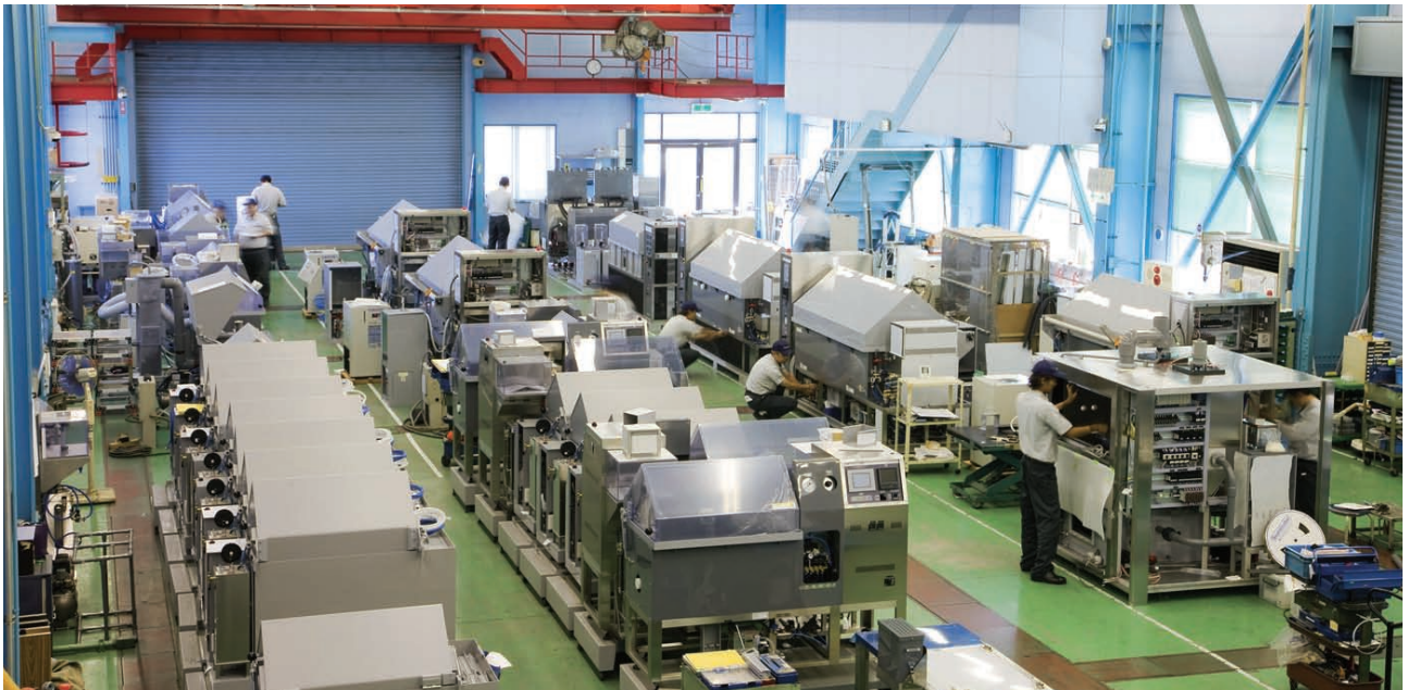
塩水噴霧、複合サイクル試験機など腐食促進試験機の生産ライン (3号館2009年10月撮影)