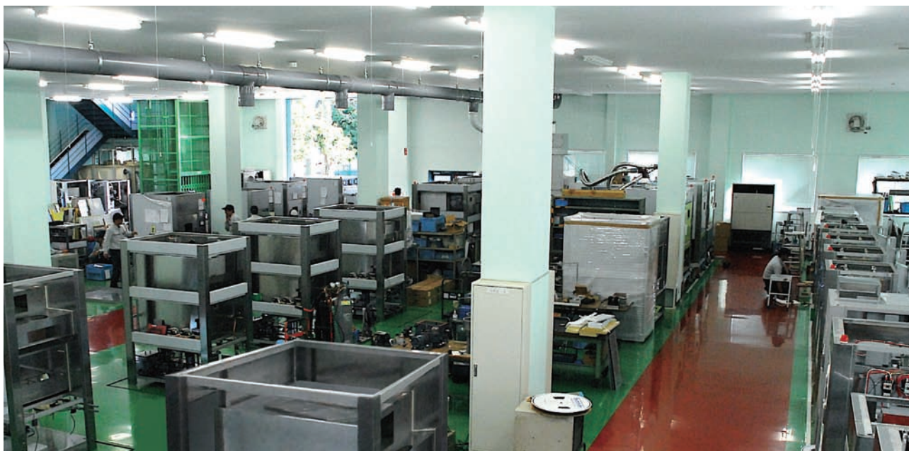
キセノン、サンシャインなど促進耐候性試験機の生産ライン (5号館2009年10月撮影)